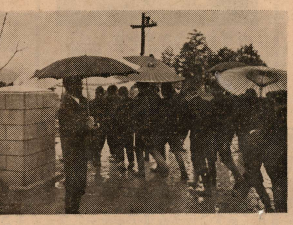
春雨の日に学窓を巣立つ中学生

今回お子様が中学校に入学されました。入学式は、おめでとうございます。入学式は、おめでとうございます。入学式は、おめでとうございます。 入学式は、おめでとうございます。入学式は、おめでとうございます。入学式は、おめでとうございます。