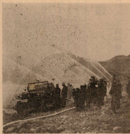
31年度消防始式風景