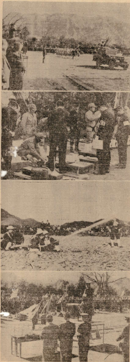
◆ 消防風景 ◆