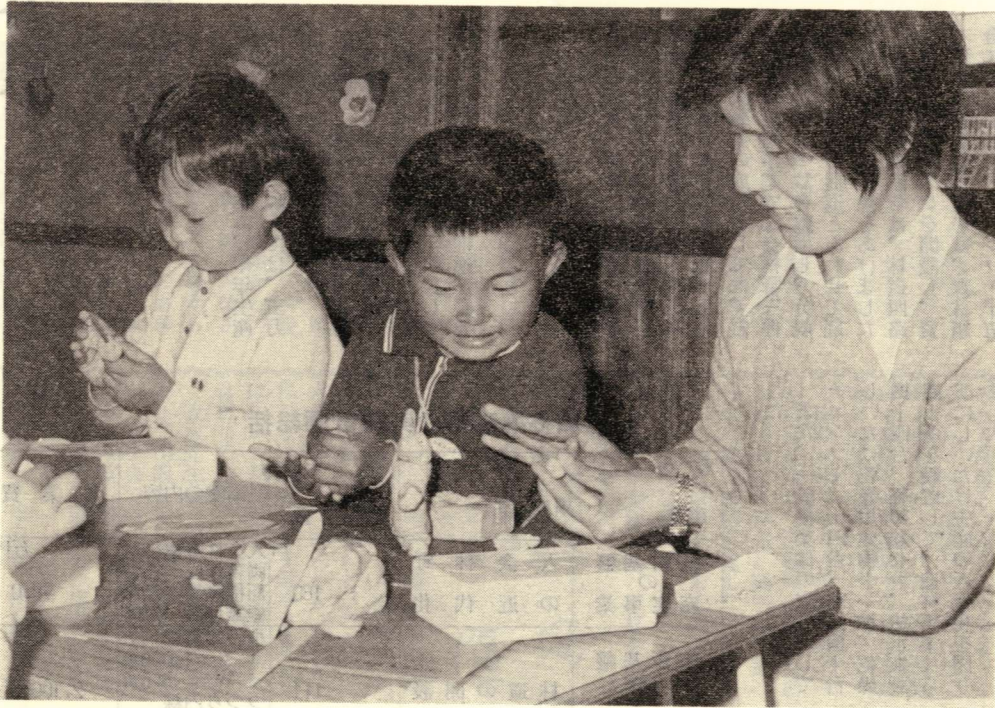
第三日曜日（二十一日）は家庭の日

保育所が設置されていますが、保育所と幼稚園とはその設置目的と機能が異なります。 保育所は、児童福祉法に基づいて設置したもので、保育に欠ける乳児や幼児を保育する施設です。 これに対して、幼稚園は学校教育法に基づいて設置するもので、幼児を保育し、適当な環境を与えその心身の発達を助長することを目的とした施設です。また、幼稚園に入園できるのは、満三歳から小学校に就学するまでの幼児となっています。 幼稚園では、文部省の定める幼稚園要領により、言語、音楽リズム、絵画製作などの教育をします。園児たちは、早速友だちができています。元気に幼稚園生活を送っています。この子たちがすくすくと育つよう見守ってあげましょう