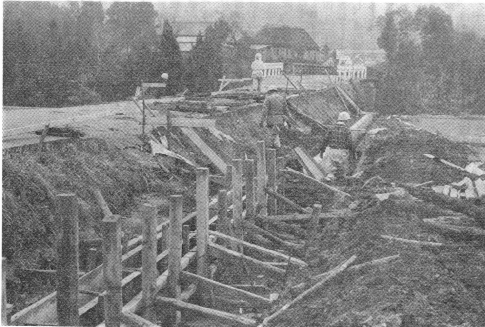
▲牧水農免道路の工事現場(久居原)

関係者のみなさんのご協力によって事業が順調にすすみ、坪谷川右岸に新しく輸送の大型化に適した農道ができて、この地区の近代化農業の発展が期待されます。