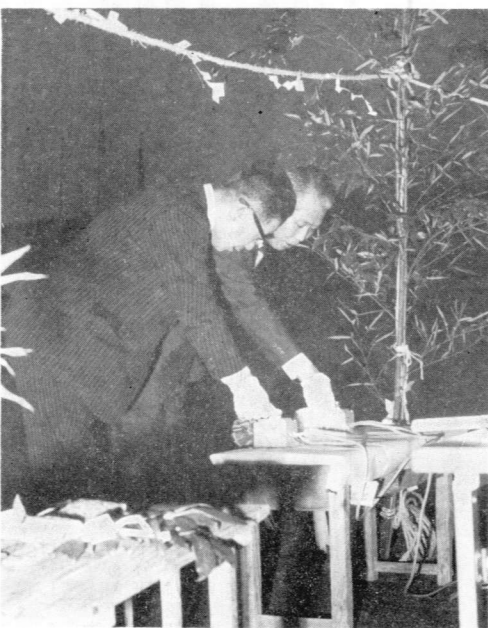
夜間照明施設の点灯式