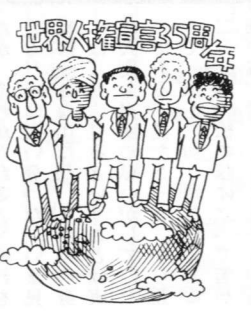
世界人権宣言35周年

「人権問題は身の回りにもある」病気になるまで初めて健康のありがたさを知るのでは遅いといわれます。人権問題に出合ってからその大切さに気づく前に、豊かな人間関係をつくるにはどうしたらいいのかを、基本的な人権の重さ、尊厳をもう一度考えたいものです。