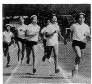
小中学校合同体育大会