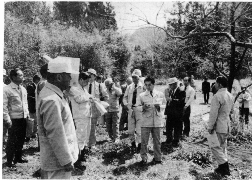
▼全国育樹祭候補地（下水流）を視察する県北広域圏の関係者

察・調査を行っており、県北では本町がその中に含まれています。 当日は、県北十四市町村の市町村長、議長、森林組合長約五十名が全国育樹祭の候補地となっている仲深区下水流の現地視察を行い、誘致に向けてのなお一層の体制づくりがなされました。