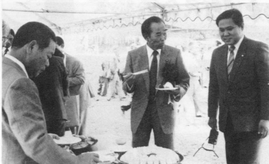
▲町グラウンドの仮設テントに設けられた立食会で婦人会が用意した山採料理に舌鼓をうつ江藤建設大臣