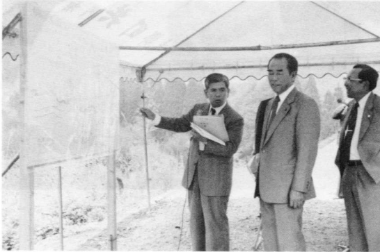
▲羽坂バイパスの早期完成に向けて図面を用いて説明を行う県土木部長

「田口原」中水流間」については、幅員が狭く急カーブが多いため車両の交差も容易にできない状況にあります。特に児童生徒の通学路であるこの区間は、車両の大型化、交通量の増加に伴い非常に危険な状態にあります。