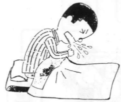
「かぜは休養が大事。」

外来で、「かぜをひいたから、よくきく注射をしてください。」といつて、腕をだされる患者さんがおられます。残念ながら、かぜの特効薬はないのです。先ほどもお話しましたように、かぜはウィルスが原因です。そのウィルスをやつつけるくすりはまだないのです。ですから、かぜぐすりというのは、鼻みず、鼻づまりには抗ヒスタミン剤、せきにはせきどめ、のどの痛み、頭痛には痛みどめ、熱には熱さましといった具合に、それぞれ症状にあつたくすりを飲んでもらうことになるわけです。 しかし、いちばん大切なことは、かぜをひいたかと思つた時には、栄養をとり、暖かくして、十分な睡眠、休養をとることです。かぜは万病のもとです。無理をしてこじらせたら、肺炎、中耳炎、ちくのうなどをひきおこすことにもなります。特に、赤ちゃん、お年寄り、他に病気になる人は、かぜをひいたら悪化しやすいので、かぜをひいた人には近づかないよう注意してください。