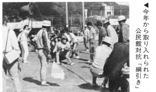
今年から取り入れられた 公民館對抗「綱引き」