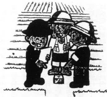
境界が明らかになって安心

全国的には、昭和二十六年から着手、二〇一六(六二%)の市町村で実施(完了・休止市町村を含む)され、その進捗率は、三二%となっています。この進捗率をみても分かるように、この地籍調査が長い年月を要し、いかに困難な事業であるかが図り知れます。本町の場合、町全面積は、二一八・六一km 2 (二一、八六一ha)ありますが、国有林・開拓パイロット事業等の一八・一五km 2 を除いた二〇〇・四六km 2 が要調査面積となっています。これを三十五年間で実施することにしています。