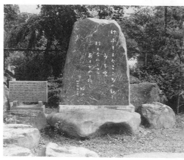
東郷小学校の歌碑

町内の児童生徒のみなさんに 親しまれている「牧水かるた」 の百首の中にもこの歌はありま すが、東郷小学校の先生は、「 歌碑ができたおかげで、子供達 の心の中にこの歌が身近かに感 じられているようです。」と話し ておられました。