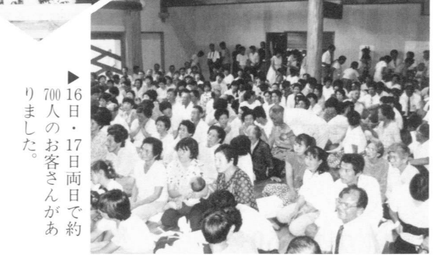
▶坪谷白太鼓踊り保存会による白太鼓踊りも好評でした。