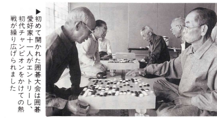
▶初めて開かれた囲碁大会は囲碁愛好家十一人がエントリーし、初代チャンピオンをかけての熱戦が繰り広げられました