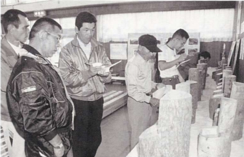
▲樹種当てクイズコーナーでは正解者わずか八人という難問クイズでした