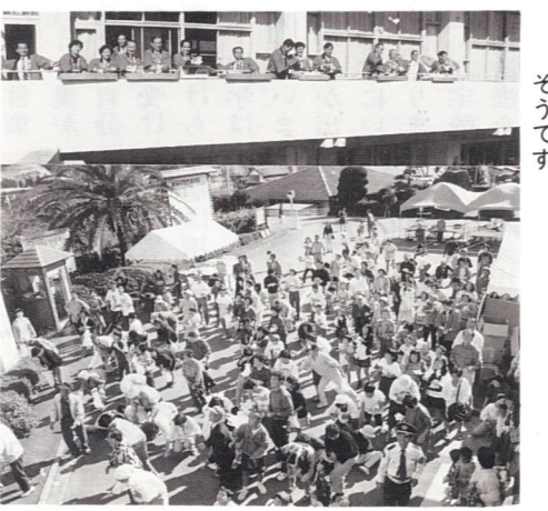
▲会場にまかれたもちは四斗分だったそうです