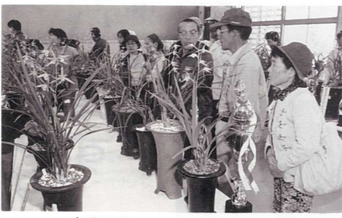
▲寒蘭展示コーナーは会場いっばいに上品な香りが漂っていました