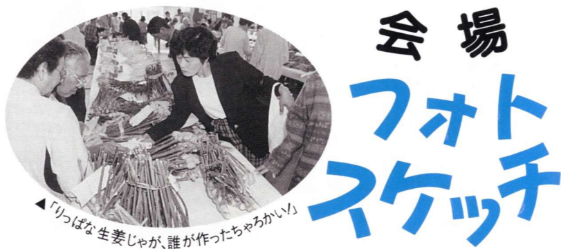
▲「りっぱな生姜じゃが、誰が作ったちやろかい」