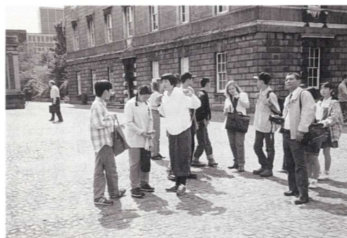
▲トリニティー大学構内にて