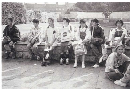
▲市内見学を終えて公園にて休憩

夕方、半日ゆくりと楽しんだ子供達も、また各家庭へと戻って行った。夜、私たち三名はエデルの姉夫妻の夕食会に招かれた。質素な中にも暖かい夕食も、丁寧に、根気よく歯磨きを続けければ、十日〜十四日もすると歯肉よりの出血が減り、腫れも改善されてきます。しかし、ブラークを完全に取除くことは難しく、残ったブラークがやがて歯石となり、歯に強くくっつきます。