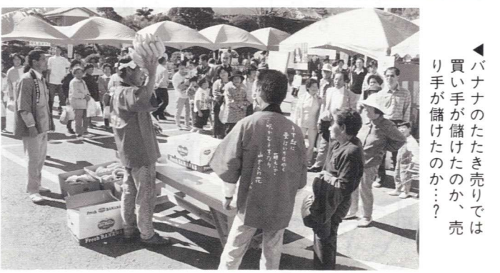
▲バナナのたたき売りでは買い手が儲けたのか、売り手が儲けたのか??