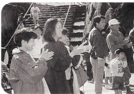
▲応援も一生懸命です