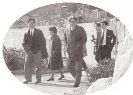
▲牧水公園「歌の小径」にて

この若山牧水賞が日本を代表する文学賞になるとともに、これを機に「牧水のふるさと東郷町」をもっと全国に発信していくようにしたいものです。