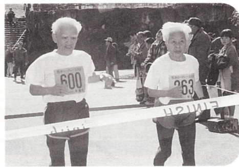
▲夫婦仲良くゴールイン