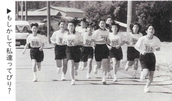
▶もしかして私達ってびり?!