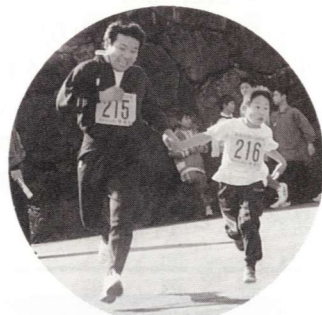
▲子供に負けてなるものか