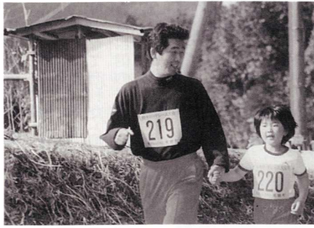
▲わが子はやっぱりかわいいものです