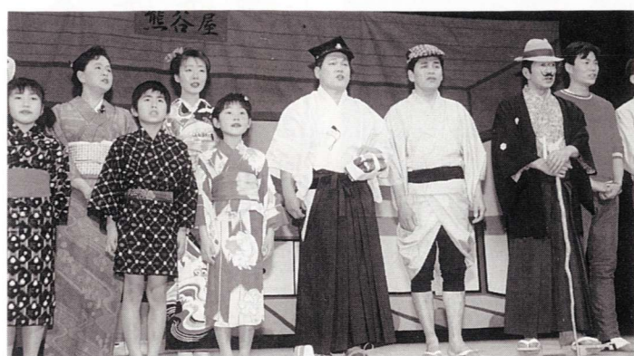
▲唄芝居のフィナーレ