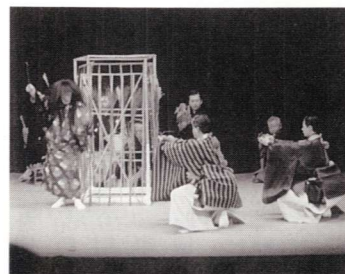
▲観客を魅了した能楽座の公演

当日は、普段はもちろん、なかなか生で見ることでない機会とあって、遠くは都城市などから訪れるなど、総勢300名が日本古来の芸能を満喫していたようです。