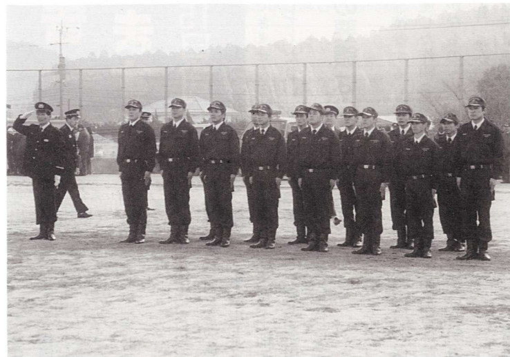
▲寒さと緊張の中、点検を受ける団員たち