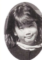
▲題「どうぶつ園にきりんがいたよ」