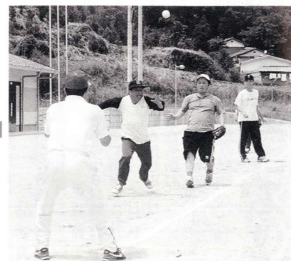
ホームでのクロスプレー

★あなたのまわりであったホットな話題をお知らせください(総務課情報管財係 69 3900まで)