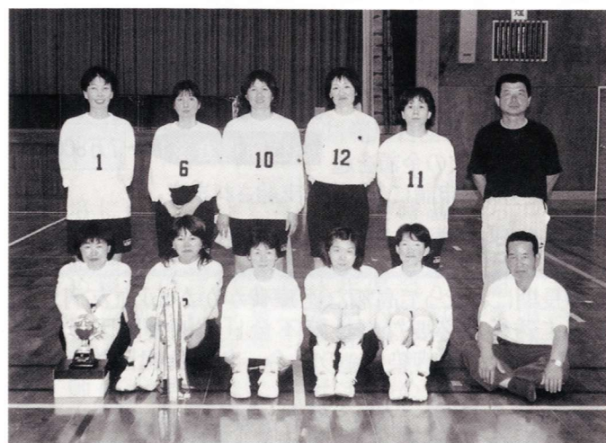
5連覇を果たした坪谷公民館チーム

平成13年度の公民館球技大会が、6月17日(日)開催されました。女子バレーボールでは、坪谷公民館が安定した力を発揮し、全ての試合で1セットも落とすことなく大会5連覇を果たしました。2位は羽坂公民館、3位は鶴野内公民館と越表下渡川公民館でした。男子ソフトボールでは、迫野内公民館が全試合10点台の得点をあげるなど、攻守に安定した力を発揮し、大会を制しました。2位は八重原公民館、3位小野田公民館でした。