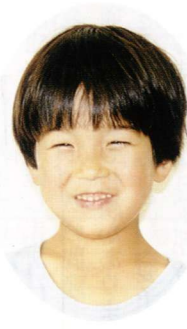
▶おとうさんのかお