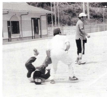
残念タッチアウト