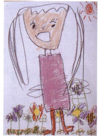
▲「おはなをつみました」