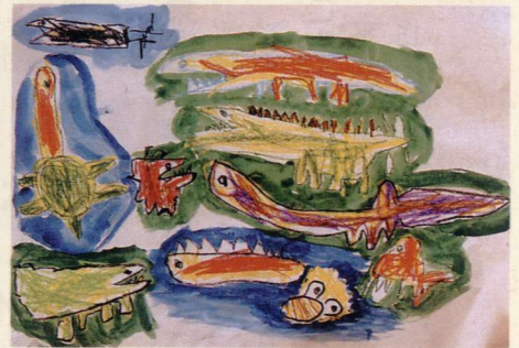
▲「きょうりゅうたち」