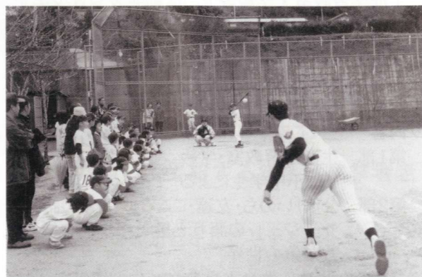
ナイスボール 投げてました