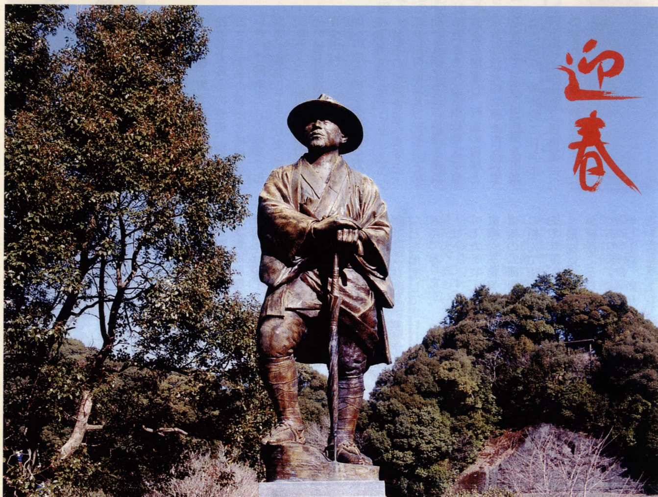
初春に何を思うや牧水像

発行 宮崎県東臼杵郡東郷町・編集 企画調整課 TEL(0982)69-3901 〒883-0192 宮崎県東臼杵郡東郷町大字山陰丙1374番地 印刷 (有)是沢印刷 日向市本町 TEL(0982)52-2567