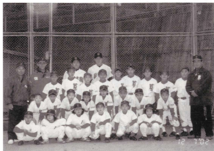
ハイッ! パチリ 記念写真