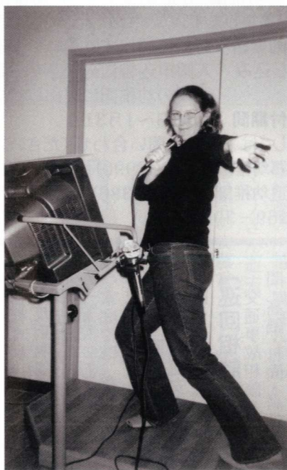
「第7番のゴール、がんばれ!」