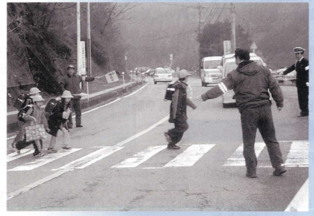
災害以来保護者による登校指導