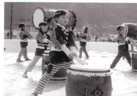
花を添えた山陰保育園の幼年消防隊