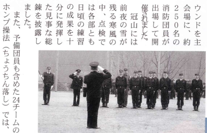
操練の部優勝の第8部団員