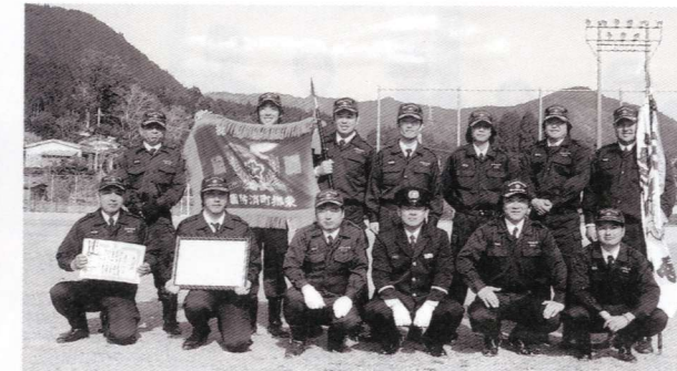
総合の部優勝の第5部団員