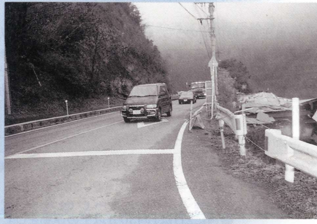
台風災害により決壊した国道

なお、全国では、交通事故や不審者による事件等、子ども達の安全確保が危惧される事件が後を絶たしません。地域の皆さまには、日頃から子ども達にご注意いただき、事故や事件等に巻き込まれることのないよう見守りをお願いします。