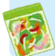
ミニトマト5個 (およそ100g) ▲