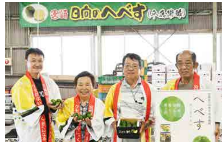
「へべす」生産者の皆さん