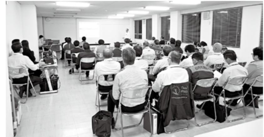
昨年、中央公民館で行ったときの様子

未来に向けて、市民の皆さんと「希望を持てる新しい日向市」の実現を目指して、市長と市民が、地域の課題や市政について直接意見を交わす座談会を開催します。 左表のとおり3ヶ月ごとの開催を予定しています。