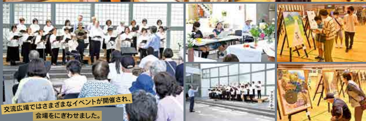
交流広場ではさまざまなイベントが開催され、 会場をにぎわせました。