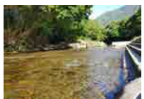
せきをする前の河川プール

今年も牧水公園河川プールを開設します！子どもたちにも大人気！牧水公園河川プールは7月20日から遊泳開始となります。遊泳期間は8月18日までです。遊泳情報はホームページで毎日お知らせしますので、「牧水公園」または「bokusui park.com」でご確認ください。