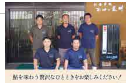
鮎を味わう贅沢なひとときをお楽しみください!