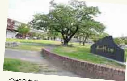
令和3年度に日向市駅前交流広場を「あくがれ広場」に命名

提案型ネーミングライツを導入し、企業などからの企画提案の 随時受け付けを開始しました。