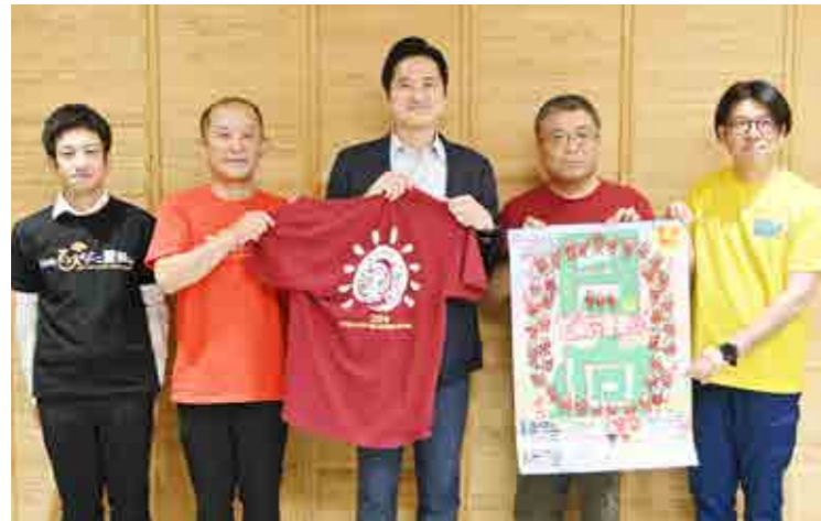
恒例のひよっこオリジナルTシャツを数量限定で販売中！