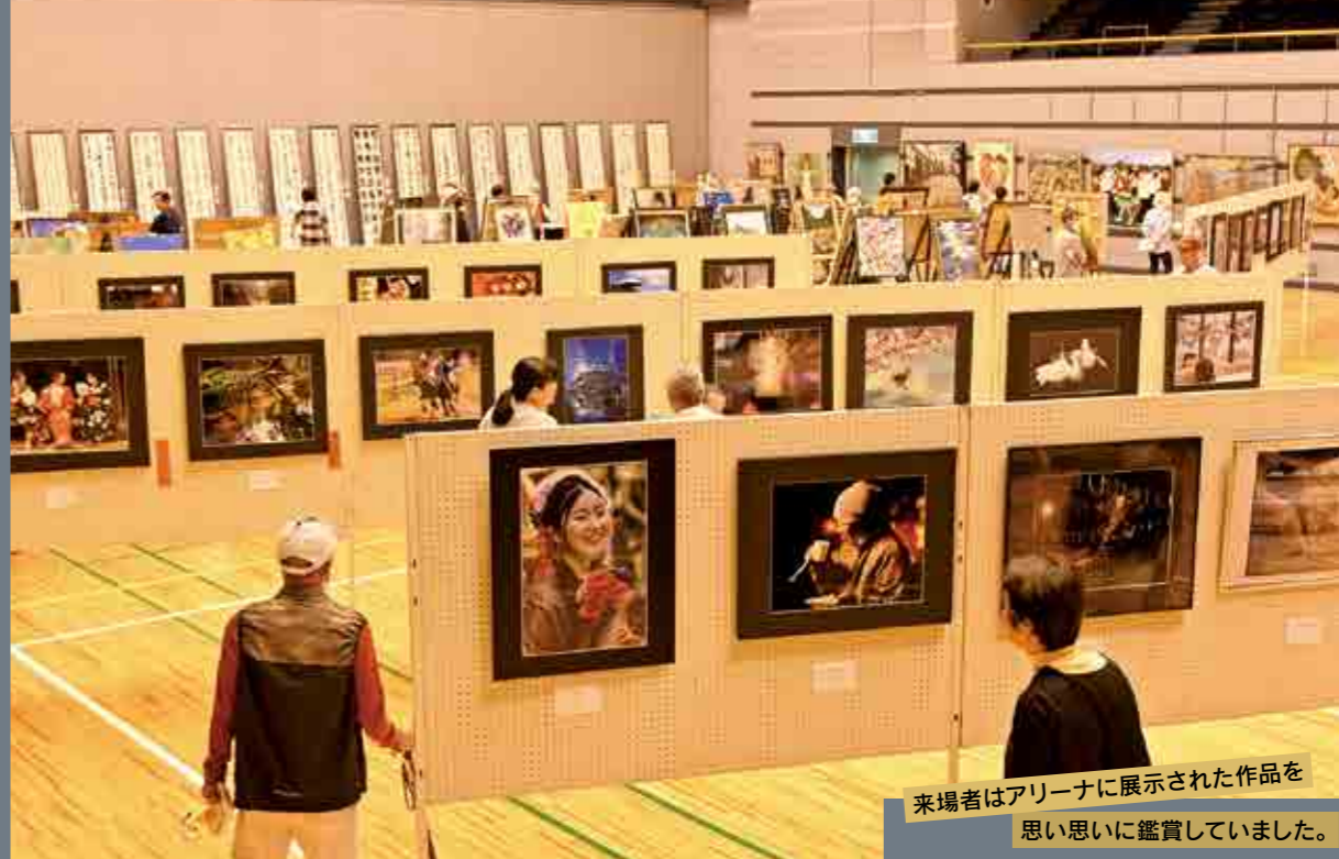
来場者はアリーナに展示された作品を 思い思いに鑑賞していました。