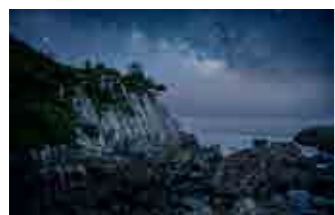
第44回日向市美術展覧会で特選に輝いた作品「岸壁に横たう天の川」

絵を描くためにきれいな写真を撮りたいと思いカメラを始めましたが、すっかりカメラの魅力にはまりました。写真を撮るためにイベントに行くことや素敵な景色を見に行くことが増え、日々、楽しんでます。これからも写真展や美術展覧会に応募していくつもりです。