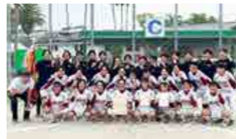
学校創立50周年の節目に初めて女子ソフトボール部が県高校総体で優勝しました。