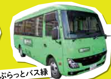
ぶらっとバス緑 市街地山側(西、北コース)