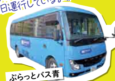
ぶらっとバス青 市街地海側(東、南コース)

ぶらっとバスは、市が運営しているコミュニティバスで、日向市駅を中心に 年末年始以外は毎日運行しているよ！ 青色 緑色 オレンジ色 の3台のバスで運行しています。