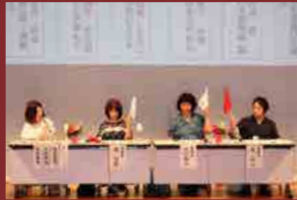
▲昨年の大会のようす