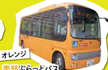
オレンジ 南部ぶらっとバス 日向市駅と美々津までの南部地区を結ぶコース